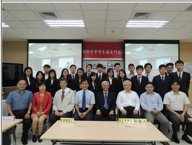
照片 1 說明：廈門銀行實習及調研報告發表會