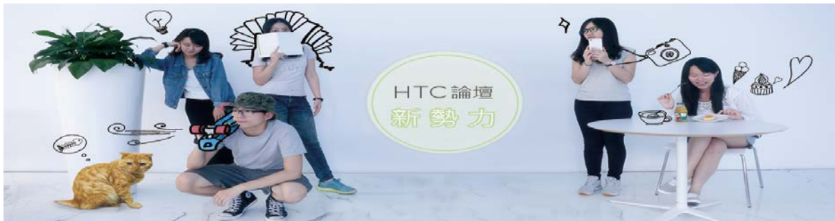
照片 5 說明：蘇世昕同學在 HTC 實習參加 HTC 論壇創立，所拍攝的照片。