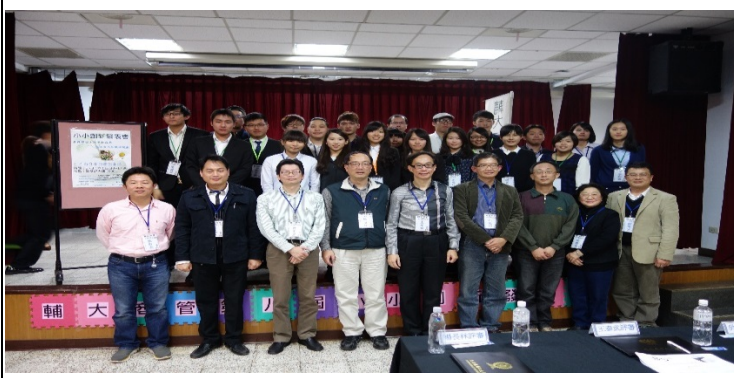
照片 1 說明：第八屆小小創新