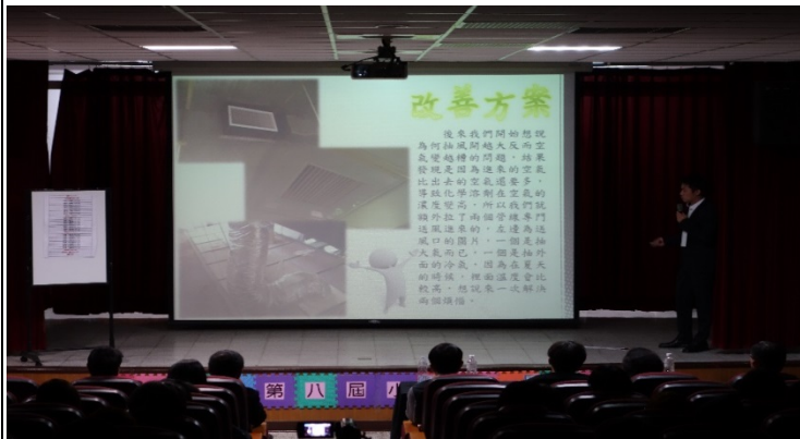
照片 3 說明：小小創新發表