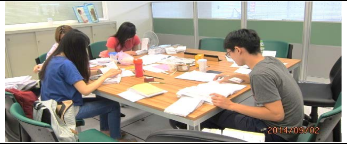
照片說明：檢視憑證