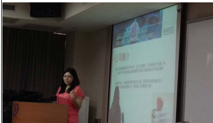
照片說明：百瑞精鼎國際股份有限公司實習生分享