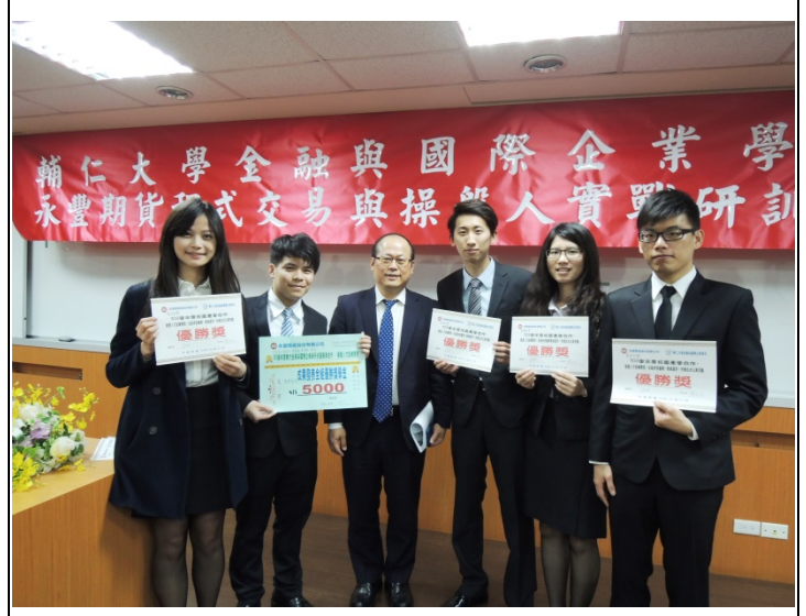
照片 4 說明：永豐期貨程式交易培訓班成果發表