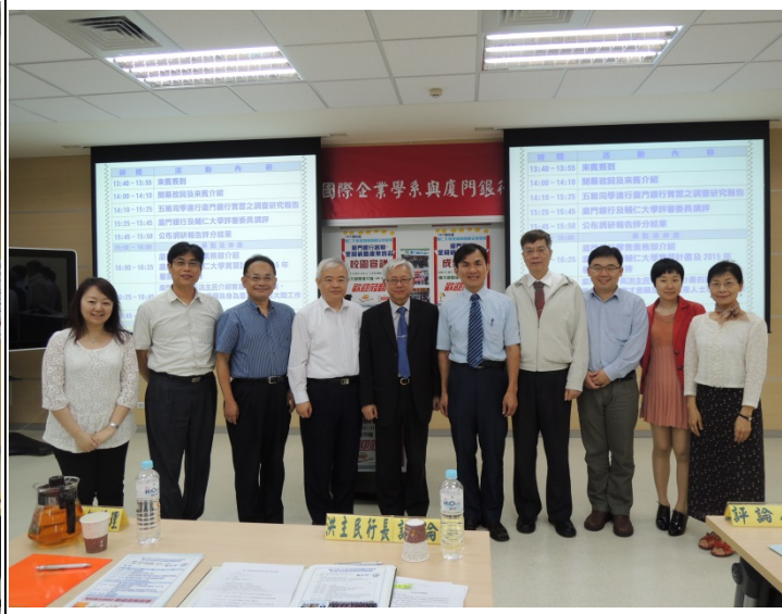
照片 2 說明：廈門銀行實習及調研報告發表會