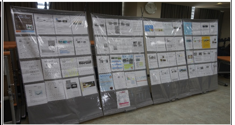
照片 4 說明：創新實踐 A4 海報展覽