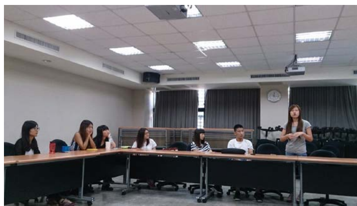
照片說明：綜合討論