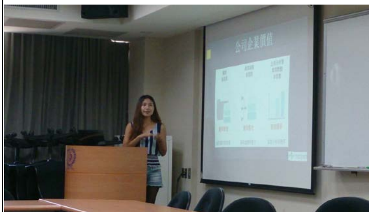
照片說明：耐特普羅資訊股份有限公司實習生分享