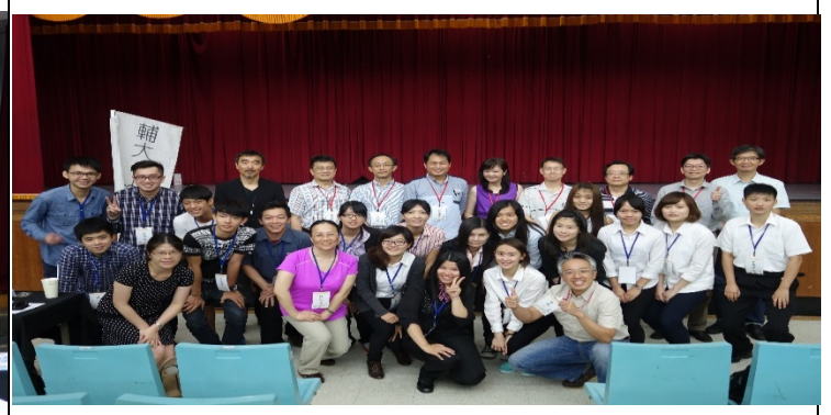
照片 2 說明：第九屆小小創新