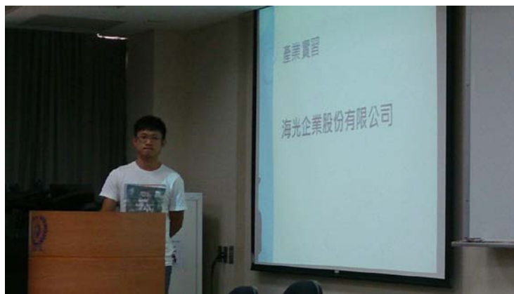
照片說明：海光企業股份有限公司專案實習生分享