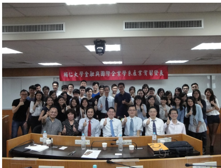
照片 3 說明：產業實習發表會(廈銀以外企業)